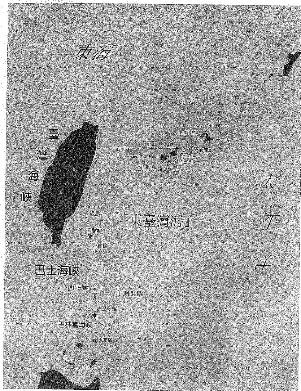
圖 1 「東臺灣海」海域示意圖

近年來，日本史學界頗為重視「海域」的研究，他們運用「區域網絡」(area network)的觀念架構，研究亞洲各個海域在歷史上扮演的角