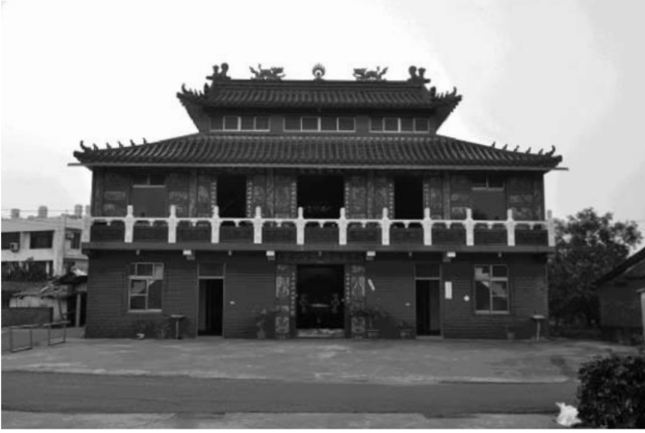
圖二、2010年時的奧法堂(照片實景)