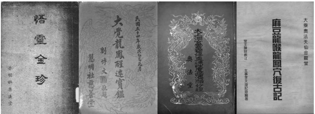
圖七、四本奧法堂書籍的封面

關於本文所提到的四本奧法堂的書籍，《悟靈金針》(1954)、《大覺龍鳳醒迷寶鑑》(1965)、《太上洞玄靈寶修真煉性度幽濟濟顯妙經》(1967)、《麻豆龍喉龍鳳穴復古記》(完成於1979，印行於1992)，前三本是鸞書，最後一本是奧法堂堂內自述的歷史。四本書的封面，可以參考圖七。