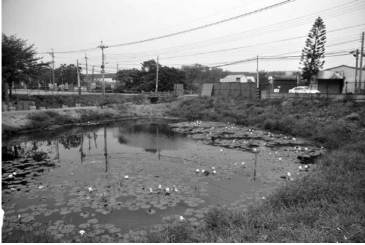
圖六、2010年時的麻豆龍喉(照片實景)