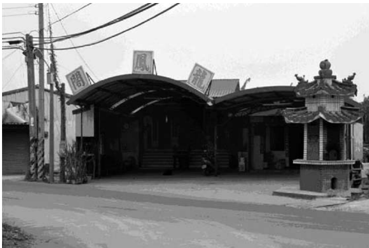
圖四、2010年時的龍鳳閣（照片實景）