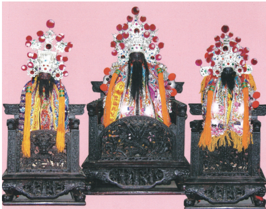
三聖始祖（畫面中由左至右依序為李老先生、三元真君與十二使祖） 榴楊王三聖始祖一三七四年聖誕祭祖大典紀念冊

李老先生係一種最崇高尊敬之稱呼，其於十二使祖出征平獠時，擔任軍師（即現今的幕僚長、參謀長、秘書、機要秘書等類稱）。其學富五車，博學廣聞，足智多謀，是十二使祖身旁難得的幕僚奇才，襄助聖祖救獠，功績卓著。今神威顯赫，益世佑民，為眾信徒崇敬所供奉，亦是最大的精神支柱。