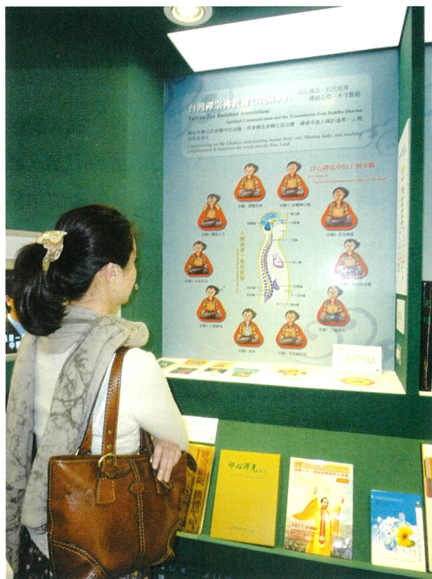
■ [印心禪學會]展示十個脈輪的修行層次。