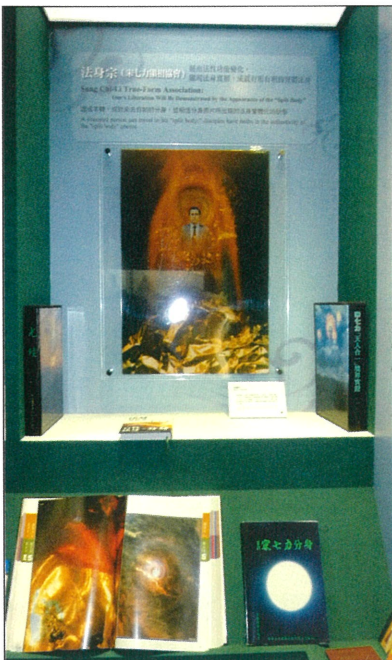
■ [法身宗] 宋七力。

地址：臺北市南港區研究院路二段 128 號 民族學研究所博物館一樓 博物館開放時間：每周三、六 9:30~16:30， 國定假日休館。 電話：02-2652-3308 傳真：02--2652-3310