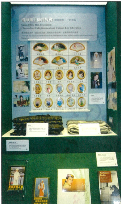
■ [清海無上師世界會]。