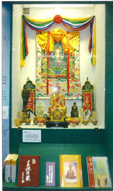
■ [真佛宗] 蓮生活佛。