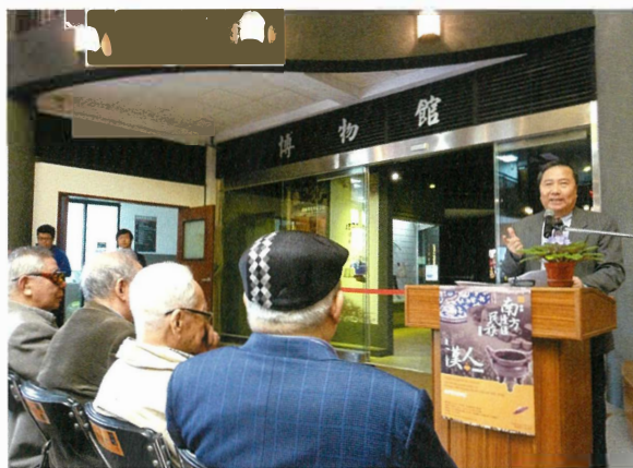
「民族所」黃所長簡要致詞。