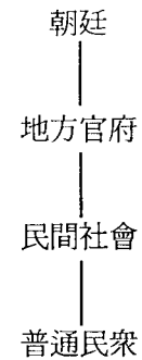
表一、傳統華人社會中的瘟疫治理模式

瘟疫在華人歷史上經常出現，在現代醫學傳入中國（十九世紀後期）之前，華人認為致病的主要原因為鬼神或疫氣所致（余新忠 2003:121-144），前者和道德因素，後者和飢寒與氣流運作等有關。大陸學者余新忠（2003:249-288）研究清代江南的瘟疫救治，探討了當時社會在四個不同層面——朝廷、官府、社會力量和普通民衆——上所分別扮演的角色（如表一），若分別來看：